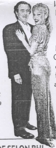
Avec Arielle Dombasle. Figure du cinéma, elle prépare une soirée sur Eric Rohmer qui l'a découverte.