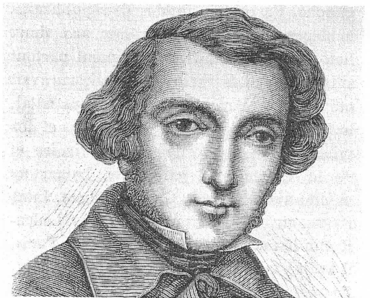
LA CHUTE DE ROBESPIERRE, en l'an II (1794), évita in extremis la guillotine aux parents d'Alexis Henri Charles de Clérel, vicomte de Tocqueville, né le 29 juin 1805.