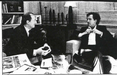
BHL a reçu Jean-Marie Rouart dans l'élégant appartement décoré par sa femme, la comédienne Arielle Dombasle.

BHL. Comme tous les mots, il a sa part de vérité mais aussi d'injustice. Prenez "American Vertigo". Le reproche que l'on pourrait faire à ce livre par rapport au genre du journal de voyage, c'est juste-