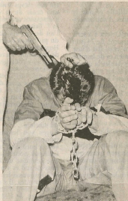
Daniel Pearl.

Le titre du livre de BHL est trompeur. On sait depuis longtemps qui a tué Daniel Pearl. C'est Omar Sheikh, un islamiste pur et dur, d'origine britannique, un combattant du Jihad au Pakistan. « Cerveau » de l'enlèvement et de l'exécution de Daniel Pearl, Omar Sheikh a, depuis, été arrêté par les autorités pakistanaises et condamné à mort par pendaison. Mais pour Bernard-Henri Lévy, il s'agit bien de savoir « pourquoi » on a tué Daniel Pearl. Qui a « vraiment » tué Daniel Pearl, qui a armé le bras d'Omar Sheikh, et quels secrets le journaliste