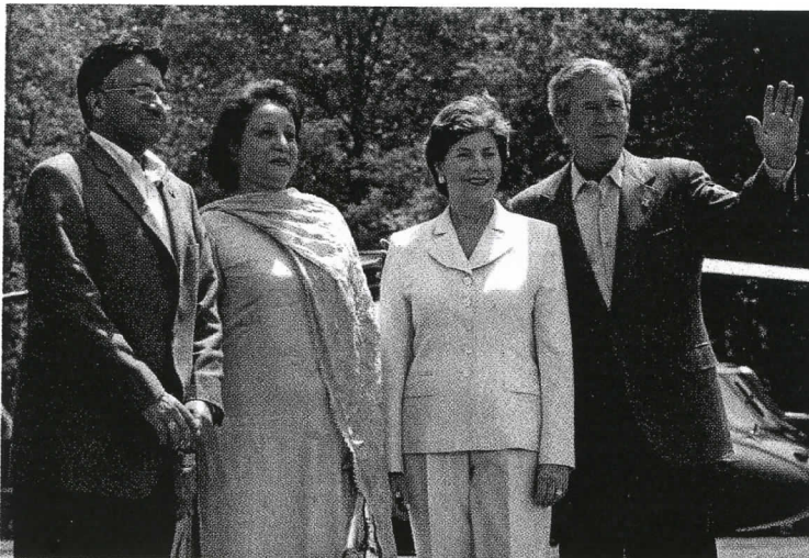
Le président du Pakistan Musharaf en visite chez G.W. Bush

● Pour vous, l'islamisme est le Mal absolu, la nouvelle «barbarie à visage humain» ?