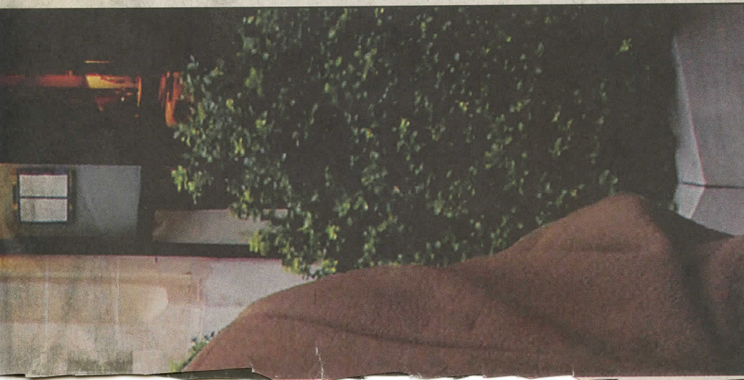
maner den unge generasjonen til aksjon.

ber. - Man trodde at demokratiet allerede hadde triumfer. Demokratiets siste fiende, kommunismen, var beseiret. Stemningen var euforisk, med en slags lyrisk illusjon om liberalismen, og en annen illusjon om at historien var endt. 11. september eksploderte alt dette.