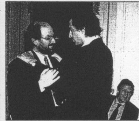
Ci-dessous, à Paris avec Salmaan Rushdie et Bernard Kouchner.

- Peut-on opérer une distinction entre les guerres qui ont du sens et celles qui n'en ont pas, ou plus ?