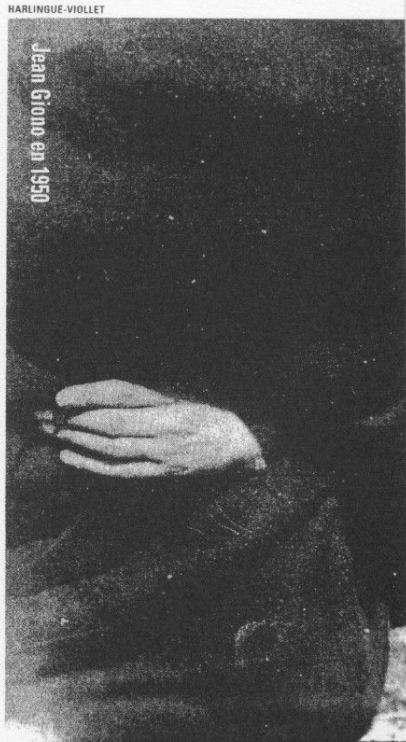
Jean Giono en 1950

mer une seconde chance... vocabulaire inusité (sous-entrière; églogue; cour-bache), Giono abandonne, dès la page 25, celui qui a mis « toute sa terre dans ses vers », afin de raconter ses propres années d'apprentissage. L'occasion de donner de très beaux chapitres sur son enfance, entre une maman blanchisseuse et un papa cordonnier, préambule de joies insoupçonnées à son passage au Compitor national d'escrime où il « tripotait » plusieurs millions par jour. Aucun billet ne sentait aussi bon que la harde de lard... « Je suis l'enfant de la vieillesse de mon père qui pleura à l'enterrement de Victor Hugo », dit-il, célébrant leurs années communes de pauvreté. Persuadé que le vrai titre des livres est le nom de leur auteur respectif, le lecteur Giono fait don de sa personne à l'écriture, juste