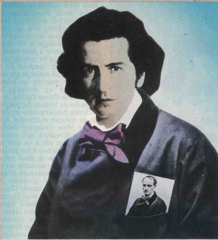
Bernard-Henri Lévy en Baudelaire (photographié par Carjat).

L. MONIER, D.R./GALERIE TRETIAKOV, MOSCOU