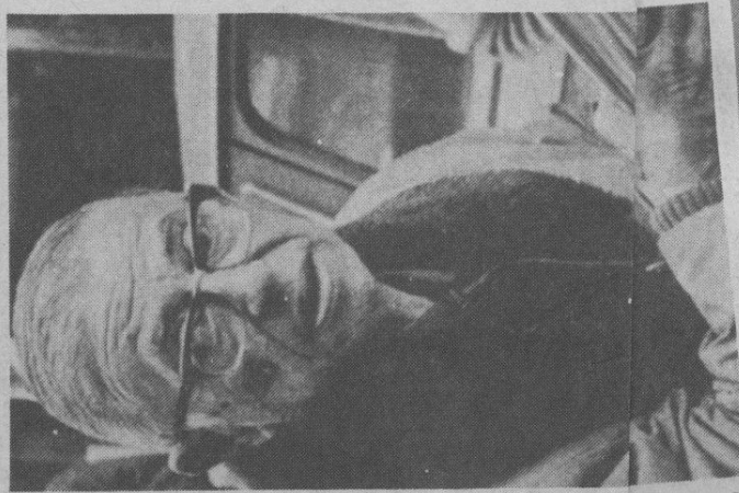
Sartre dibujando "La causa del Pueblo"

En ese momento, los intelectuales dejaron de servir. Abandonaron su espacio de reflexión y su papel. Un papel que Bernard Henry Levy define a lo largo de su libro. El intelectual es, escribe, el debate, la trascendencia del saber, del concepto, de la ley. Es el otro. La preocupación del otro. Es la ilusión de un mundo donde prevalecerían los valores universales. El intelectual es la justicia, la razón. Es alguien que muestra el mundo en su complejidad. No es un individuo. Es una dimensión de la sociedad. Y una idea: que