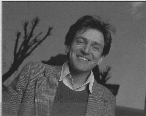
Alain Finkielkraut : l'humanisme, une idée à ressusciter.