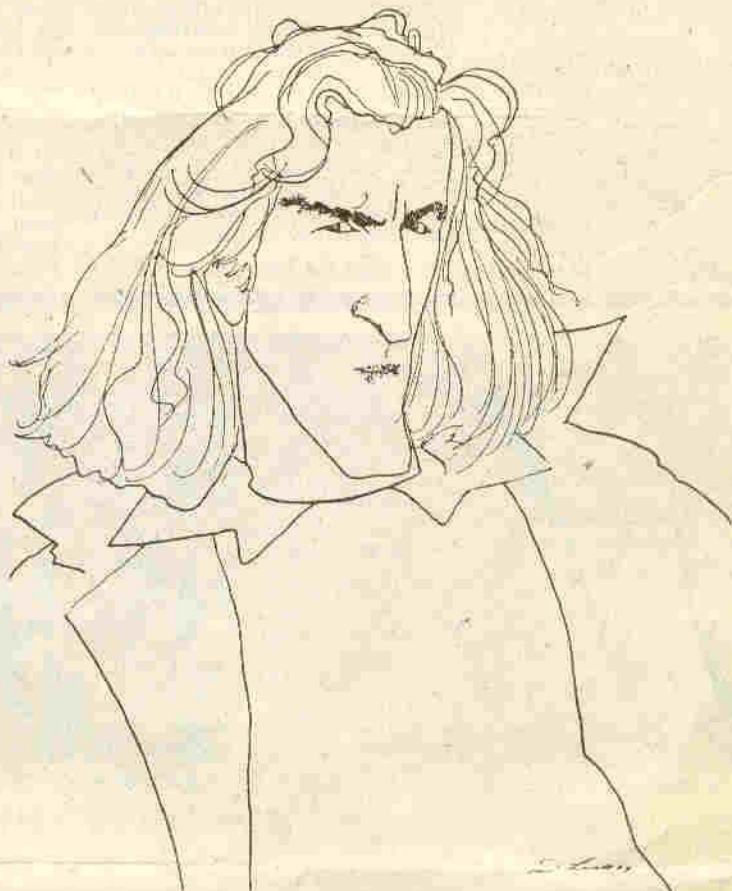
B. H. L. au naturel (en haut, à droite) et vu par Levine, qui le croqua au moment où les « Nouveaux Philosophes » faisaient leur percée aux États-Unis.

On dira : retour du signifié, retour du référent, effet de reconnaissance, mimésis. Eh bien, oui ! que diable, justement ! Levy ne s'attarde pas aux problèmes de forme, son livre est d'ailleurs sur ce point, d'une lumineuse simplicité. Composé de cinq parties qui sont soit des dispositifs de narration hérités du XIX e , comme le journal intime, la correspondance, la confession, soit des techniques plus contemporaines comme l'entretien ou la déposition, il joue de ces cinq strates de récit qui ont chacune