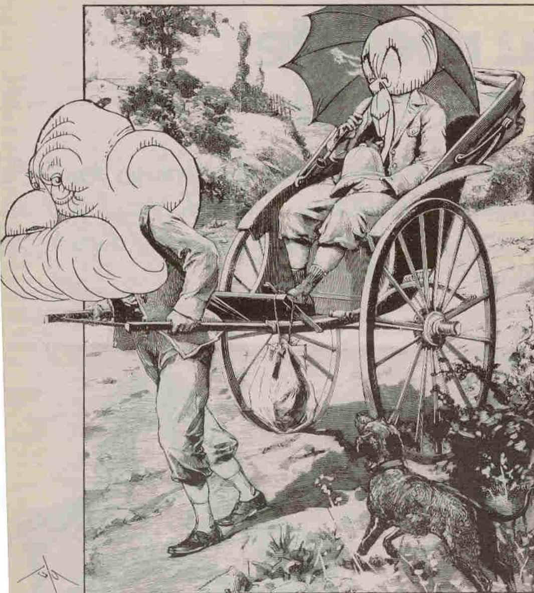
Pétain véhiculant Giscard, vu par Solo.

accusés d'intelligence avec l'ennemi, certains firent même de très honorables médailles de la Résistance. Il n'en reste moins qu'ils demeurent les plus beaux rons de ce fascisme à la française qui un vibrant sursaut nationaliste, ne voit rien devoir à Hitler ou à Mussolini. « face aux totalitarismes étrangers avant d'être totalitaires sont fondamentalement étrangers, la France a une mission est de fabriquer français. Mais aussi, surtout, de fabriquer fasciste, vraiment fasciste, authentiquement fasciste ».