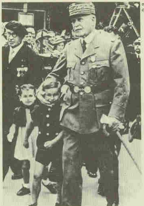
Le maréchal Pétain

B.-H. L. : Lorsque j'ai lu cet article de Paupert, j'ai été partagé entre l'indignation et la tristesse. Comme tous les juifs de France, j'ai reconnu là le vieil arsenal classique de l'antisémitisme le plus