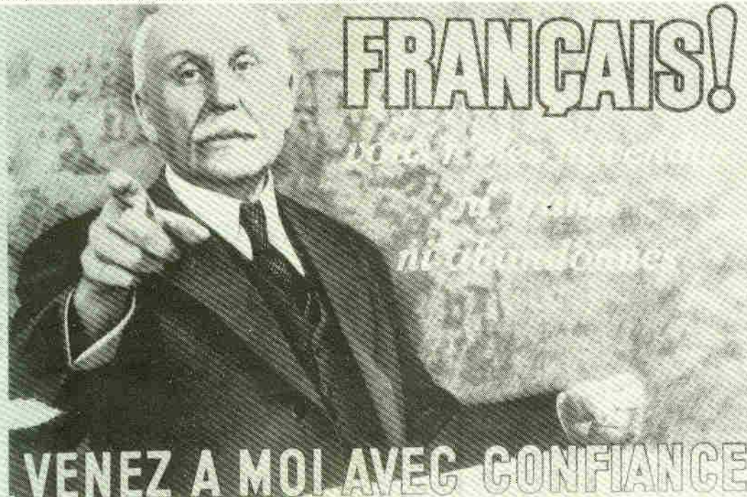
Affiche placardée au début de l'occupation sur tous les murs de France.

Il me manquait malheureusement le bouc. Je veux dire Giscard appelant, dans son message de vœux du Nouvel an, au respect des valeurs qui viennent du « plus profond de notre sang » et qui respirent « l'odeur de nos terroirs ». Et il me manquait aussi l'im-