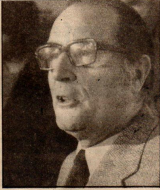
François Mitterrand : le nouveau prince de l'âge prolétarien.