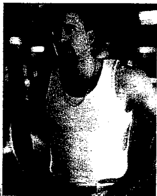
"Kiss of death", avec Nicolas Cage en chef de gang. 22.40, M6.

Un petit gangster se fait pincer. La justice lui propose un marché : sa liberté contre le nom de ses complices. Apprenant que l'un d'eux est responsable de la mort de sa femme, il accepte... Calquée sur Le Carrefour de la mort , de Henry Hathaway (1947), cette quatrième production hollywoodienne de Barbet Schroeder n'est pas un remake ordinaire. D'abord, le scénario de Richard Price prend le parti du réalisme. On est en pleine banlieue new-yorkaise (le Queens), chez les voleurs de voitures, dans une ambiance de méfiance et de racket. Une bonne idée : confier à David Caruso, révélé par la série télé New York Police Blues , le rôle de Jimmy, le petit truand qui navigue en eaux troubles, aux prises avec un flic pas trop pourri (Samuel L. Jackson) et un chef de gang à la fois terrifiant et touchant (Nicolas Cage). Pendant la première moitié du film, le cinéaste et ses acteurs tiennent leur tempo. Puis la tension baisse et Barbet Schroeder se contente de finir honnêtement ce qu'il avait si bien commencé. F.Go.