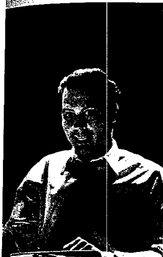
la série Z, cherchez Tim Burton... Arte.