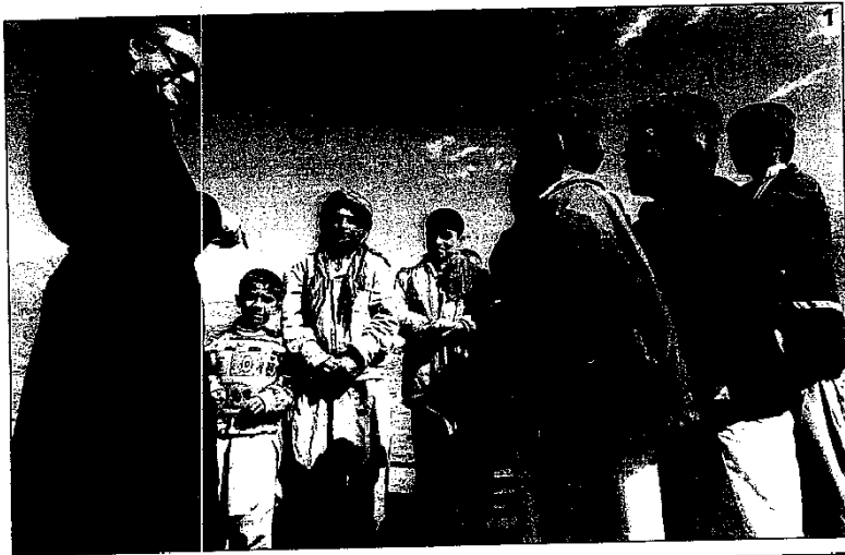
1. Bernard-Henri Lévy dans la vallée du Panshir en février 2002, lors de sa mission pour le gouvernement français. 2. Lors de son enquête, BHL a pénétré dans la mosquée Binori Town, le sanctuaire des fondamentalistes, qui a hébergé et protégé Oussama Ben Laden.