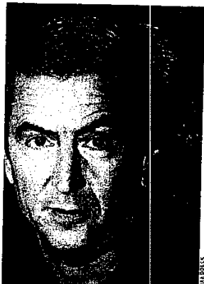
BHL a accédé aux sources de services secrets.

Le flamboyant Bernard-Henri Levy, qui a troqué la chemise blanche pour le tee-shirt noir, est à la diète médiatique depuis le début du conflit. Son Bloc-Notes publié en dernière page de l'hebdomadaire « Le Point » est suspendu depuis plusieurs semaines. La raison de ce silence ? Le lancement prochain de son nouveau livre, une enquête consacré au journaliste du « Wall Street Journal » Daniel Pearl, décapité au Pakistan par des membres d'Al-Qaeda. BHL a eu accès aux plus hautes sources des services secrets français, américains et pakistanais pour mener son investigation. Disponible en librairie le 22 avril prochain et à partir du 11 pour une poignée de journalistes, ce dernier opus sobrement titré « Qui a tué Daniel Pearl ? » devrait rencontrer le même succès que son cadet « Réflexions sur la Guerre, le Mal et la fin de l'Histoire » qui avait dépassé les cent mille exemplaires vendus. La locomotive BHL sera l'occasion de dynamiser un marché de l'édition en très net repli, les cent meilleures ventes de littérature générale affichant une baisse de 13 % depuis le 13 mars (source Ipsos).