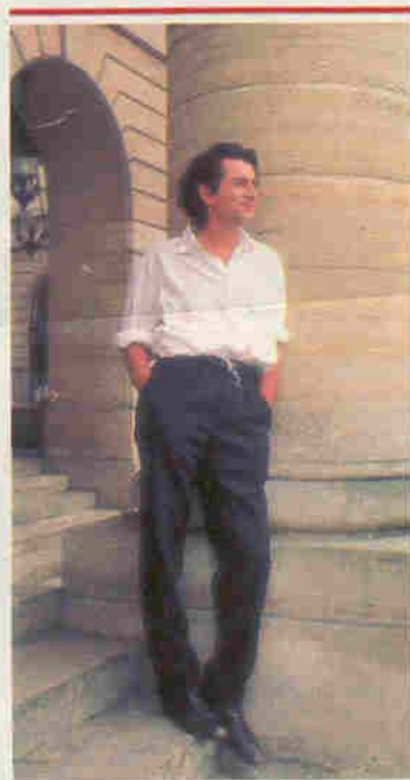
Un scoop : il peut sourire !

“Le vrai Baudelaire était un intrigant doublé d'un incroyable flatteur...”