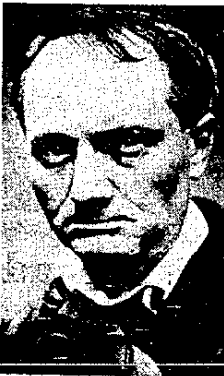
L'hôtel du Grand Mirail, vers 1900, et deux de ses pensionnaires : Baudelaire et Bernard-Henri Lévy.