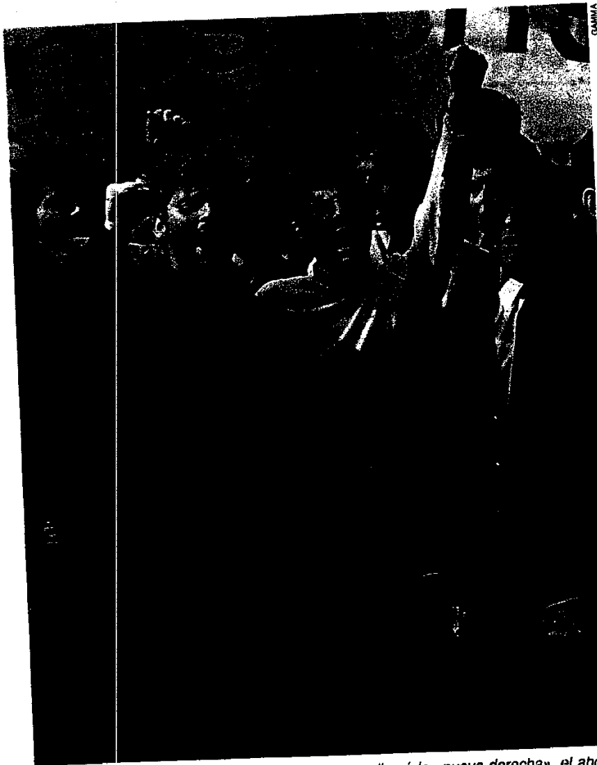
Revisión. Junto con los compañeros de lo que se llamó la «nueva derecha», el ahora novelista hizo una dura crítica de la izquierda francesa.