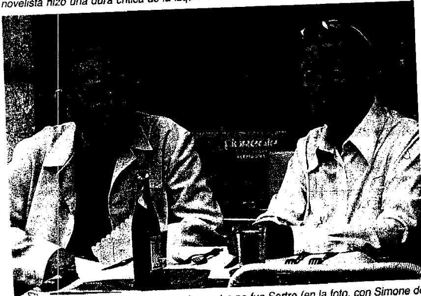
Santón. Para Bernard Henry-Lévy, el maestro no fue Sartre (en la foto, con Simone de Beauvoir), con quien colaboró, sino Foucault y Althusser.