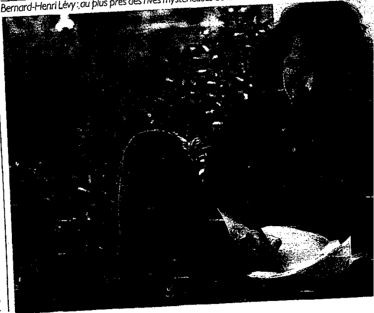
Bernard-Henri Lévy : au plus près des rives mystérieuses de la création, de la souffrance et de la mort.

Sur un titre qu'ils ont failli avoir en commun et un détail amusant, il n'y a rien de comparable entre le Pouchkine de Besson et le Baudelaire de B.-H.L. Le détail : c'est le goût quasi fétichiste pour le pied des dames dont témoignent Pouchkine et Baudelaire. Leur façon de prendre leur pied, en somme. D'où une scène brûlante, assez drôle quand Baudelaire rêve de faire tomber la chaussure de la Présidente qui va l'introduire dans les fameux déjeuners de la rue Frochot en compagnie de Feydeau, de Maxime Du Camp, Théophile Gautier. Elle est si réussie qu'elle mérite de figurer dans une anthologie au côté de celle où Julien Sorel rêve de prendre la main de Mme de Rênal. Autant le Pouchkine de Besson est plaisant, simple, léger, brillant, écrit au fil de la plume, facile en tous les sens du terme, autant le Baudelaire de Bernard-Henri Lévy tout aussi brillant mais en profondeur est grave, douloureux presque, savamment et habilement composé, de plus de poids sans être pesant. Sans doute est-ce dû