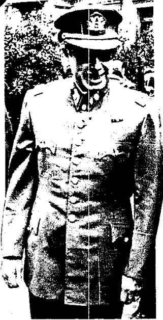
Le Général Pinochet et la victime de l'Inquisition peint par Goya