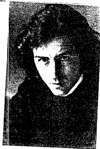
Bernard-Henry Lévy ci-dessous Moïse et le Buisson ardent.