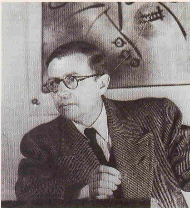
Jean-Paul Sartre vers 1950.