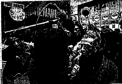
Jean-Paul Sartre chez Renault en mars 1972.