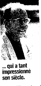
... qui a tant impressionné son siècle.

●●● exprimé, une salle de soin ; de quoi euphémiser les coups, les transformer subtilement en autant de motifs d'excuse et d'affection. On dirait un livre écrit de l'intérieur d'une cage de verre : tout est dit, rien ne porte réellement. On demeure dans le 50-50. Tout se passe comme si Lévy craignait, comme Michel-Antoine Burnier dans son propre livre ( voir ci-dessous ), de dire adieu à Sartre. C'est la plus