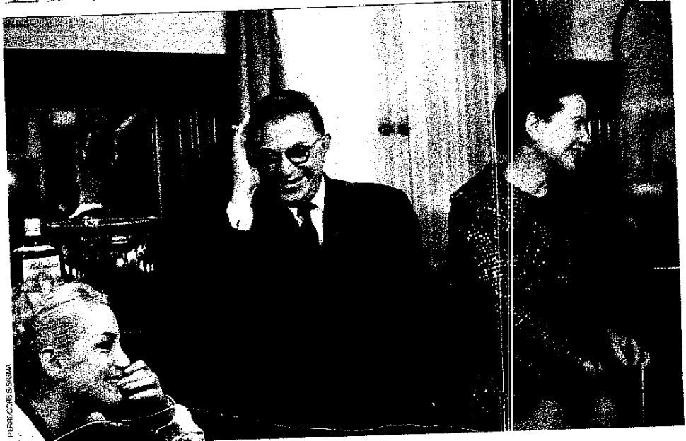
Dans un théâtre, avec Simone de Beauvoir, en 1959.

Bureau de Vérification de la Publicité B-V-P 17, rue de l'Arrivée 75733 Paris Cedex 15 Tél. : 01-55-91-11-11 Fax : 01-55-91-11-12 Le BVP est un organisme indépendant qui publie dans son annuaire les noms des professionnels de la publicité. Les renseignements sont fournis gratuitement sur demande écrite et sans aucune obligation de la part de l'annonceur.