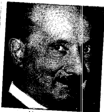
Martin Heidegger Pour lui l'"existence" n'a rien à voir avec le subjectivisme

Dès 1935, donc rétrospectivement, Heidegger dit ceci : « Ce qui