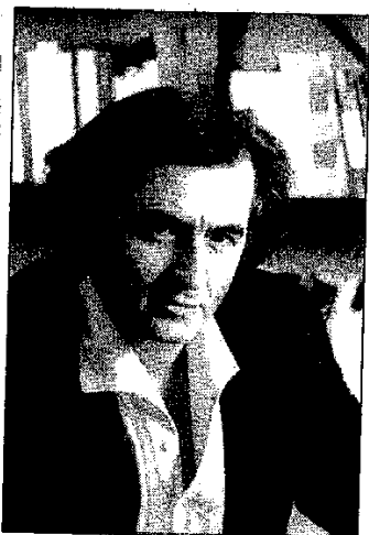
Bernard-Henri Lévy Un pontife de carnaval

C'est ce que Heidegger a compris dès 1934, ce n'est pas encore