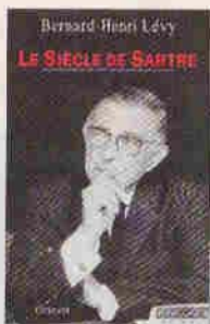
Le livre événement. Le Siècle de Sartre de Bernard-Henri Lévy vient de paraître chez Grasset (663 p., 148 F.).

1. Réparateur. Bernard-Henri Lévy raccommode Sartre en le reliant à ses maîtres, ses compagnons et même ses enfants spirituels.