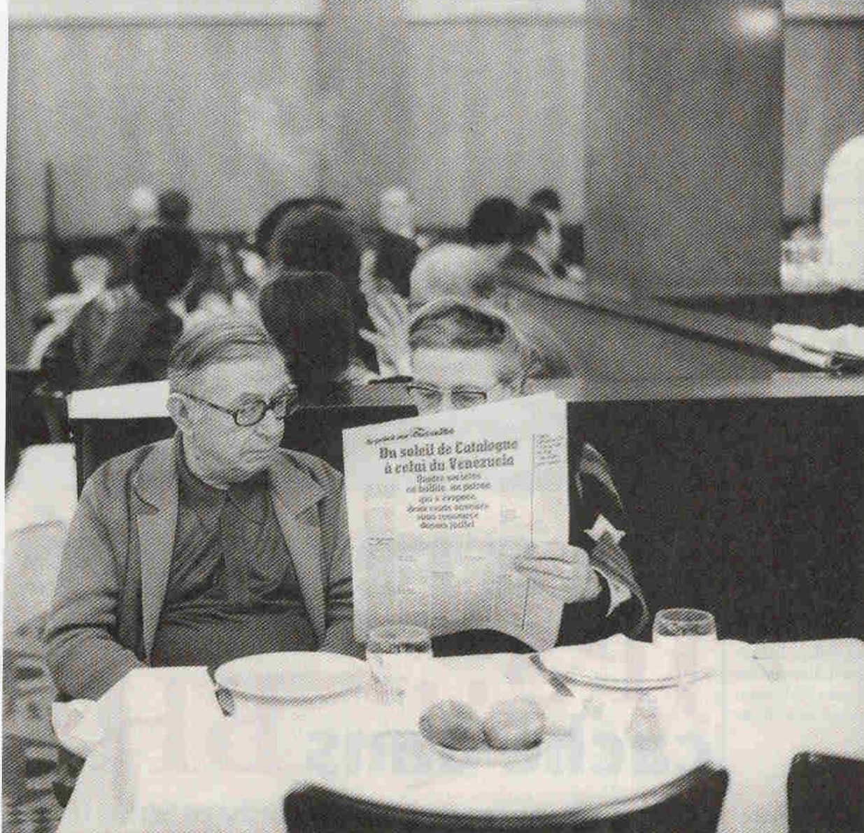
En 1973, à la brasserie La Coupole, Sartre étant alors presque aveugle, Simone de Beauvoir lui lit le journal à voix haute.

car il en connaît l'intime duplicité. Entre l'individualisme révolté de Roquentin et l'humanisme poisseux de l'Autodidacte, il y a le peuple juif, la Loi de Moïse, une façon de vivre en société sans s'asservir au collectif. Pour un peuple composé d'individus à la nuque raide, c'est un lien librement consenti, à l'exacte jointure que, jusqu'alors, Sartre n'avait pas trouvée. Sartre devenu juif? Evidemment, cela fait du tapage. Simone de Beauvoir n'apprécie pas, parle de tribunal – oui, elle! Pourtant, Sartre vient brutalement de retrouver le premier Sartre. Il faut voir comment il traite son autobiographie, les Mots ! Il la taille en pièces – et Lévy aussi. Le succès que rencontrèrent les Mots était suspect. Sartre avait averti: c'était un adieu à la littérature, un adieu qu'il voulait avec un bel écrire. Que ce petit livre banal soit lu comme son chef-d'œuvre a de quoi faire enrager.