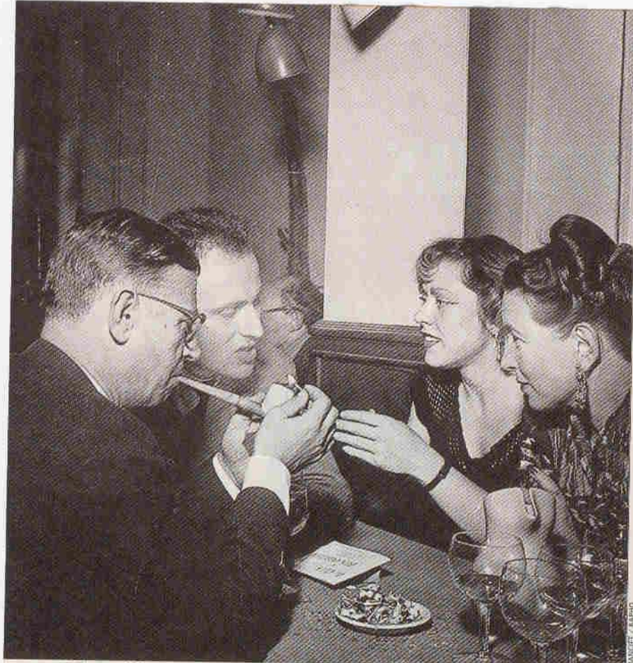
Existentialisme. Sartre au café Procope en 1952 avec Boris Vian et Simone de Beauvoir.

notre temps, de le comprendre ici et maintenant, sans jamais se placer du point de vue de l'éternité. Et cela impliquait ces prises de position innombrables, sur les sujets les plus divers, qui ont fait une part de sa légende. Je suis très fier, moi qui suis très lié à la cause basque, de posséder le manuscrit de la préface que Sartre