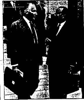
Debré, le père de la Constitution, a une telle stature de gaulliste historique qu'on en oublierait presque qu'il a été aussi le ministre (de la Défense, de 1969 à 1973) de Pompidou président, après avoir été le ministre de l'Economie de Pompidou Premier ministre (ci-dessus, en 1967).

E loigné de toute afféterie, de toute pose, de l'idée même qu'il est un personnage, Michel Debré publie un livre passionnant et poignant. C'est une histoire d'amitié, celle d'hommes jeunes, unis par l'admiration qu'ils portaient au général de Gaulle, mais aussi par la vie, les déjeuners, les coups de fil, les femmes et les enfants. On réalise qu'on ne sait rien de Georges Pompidou, Olivier Guichard,